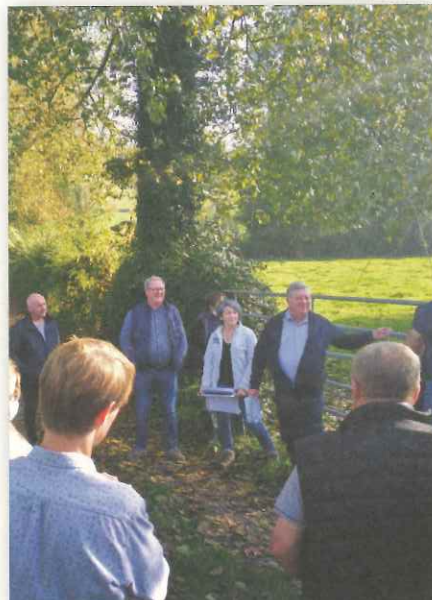
Les élus du SYMVAHEM, l'Association de Protection des Habitants de la Vallée de la Hem et les partenaires ont visité Champ d'inondation contrôlée de Merck-Saint-Liévin sur le territoire du SmageAa

Une visite de la localisation potentielle des 4 champs d'inondation contrôlée s'est déroulée le 23 septembre 2021 matin sur