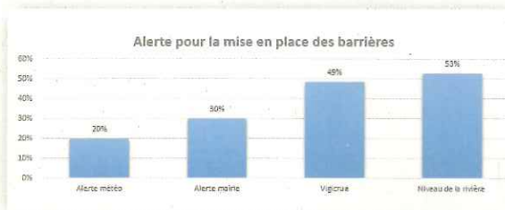
Les moyens d'alerte sur l'emploi des barrières anti-inondations

Un suivi annuel est assuré dans le cadre d'une convention entre le SYMVAHEM et les communes. En effet, ces dernières informent le SYMVAHEM de tout changement (problèmes liés aux barrières anti inondation, changement de propriétaires et/ou locataires...)